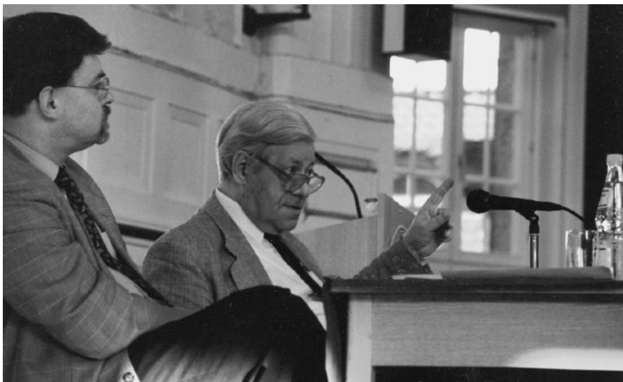
Vortrag von Bundeskanzler a.D. Helmut Schmidt in der Universität Hamburg im Rahmen der IFSH-Vorlesungsreihe „Wissenschaft und Praxis im Dialog“ 1997