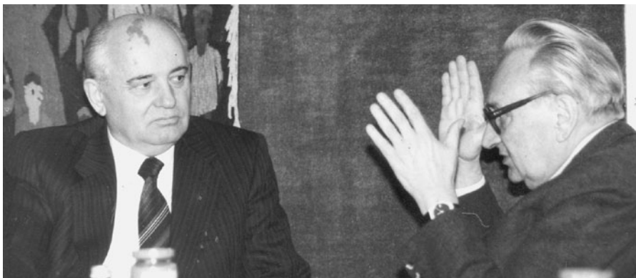
Friedensnobelpreisträger Michail Gorbatschow mit Egon Bahr bei seinem Besuch im IFSH 1992