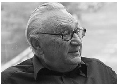
Egon Bahr, 1984 - 1994