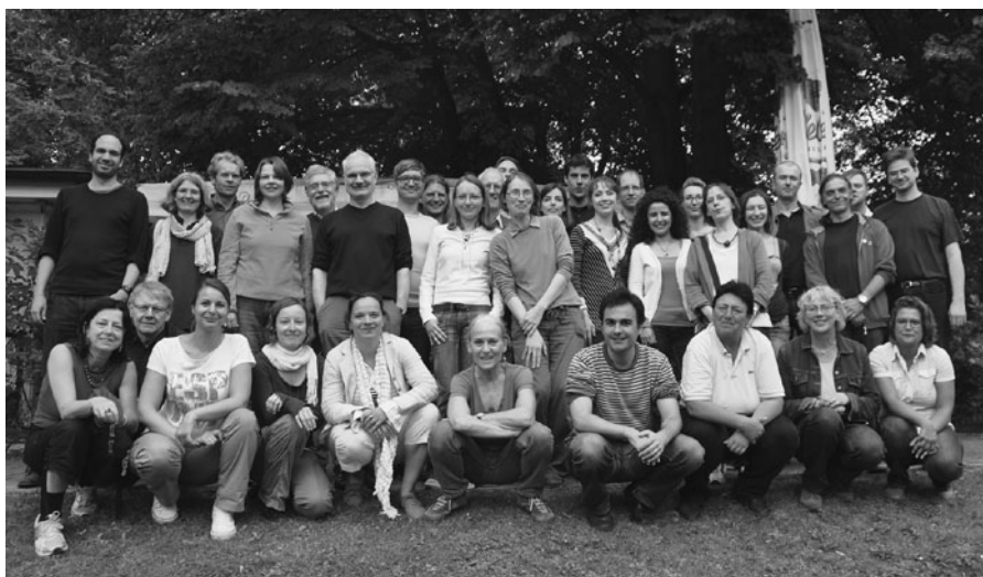
Mitarbeiterinnen und Mitarbeiter des IFSH im Juli 2011