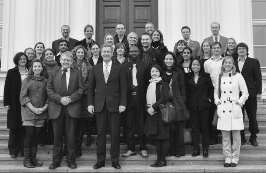
MPS im Oktober 2010 auf der Berlin-Exkursion mit Bundespräsident Christian Wulff