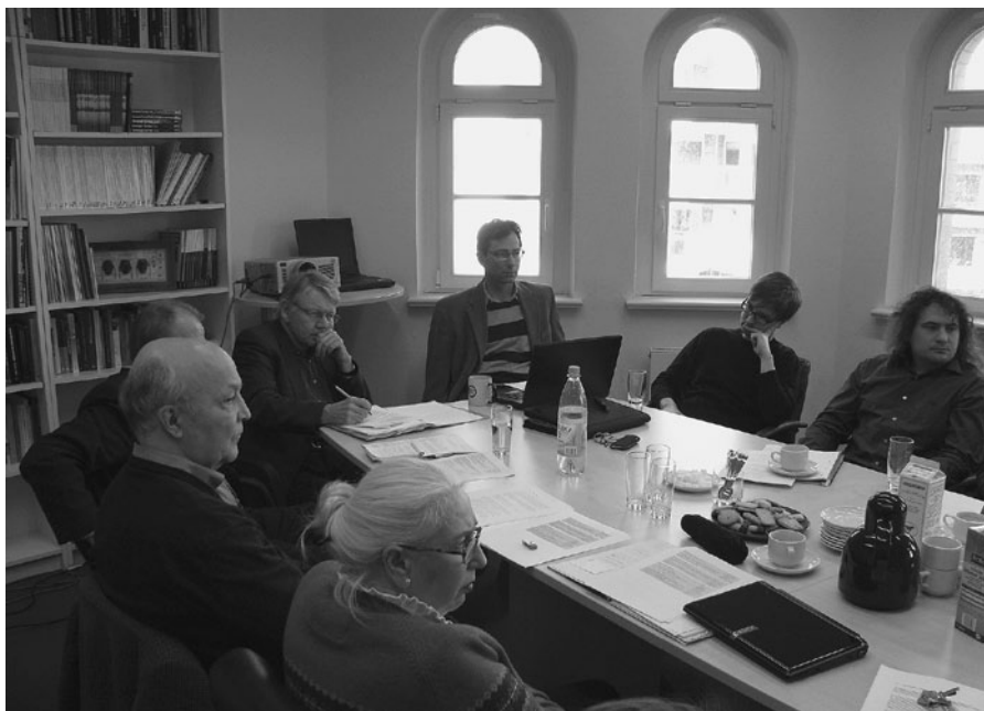
Workshop „Wege aus der Gewalt“ im Februar 2011 im IFSH