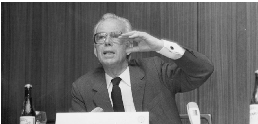
Wolf Graf von Baudissin bei einer Diskussionsveranstaltung 1977